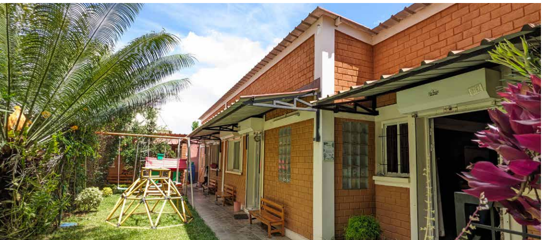
Tots Haven – eine grüne Oase.