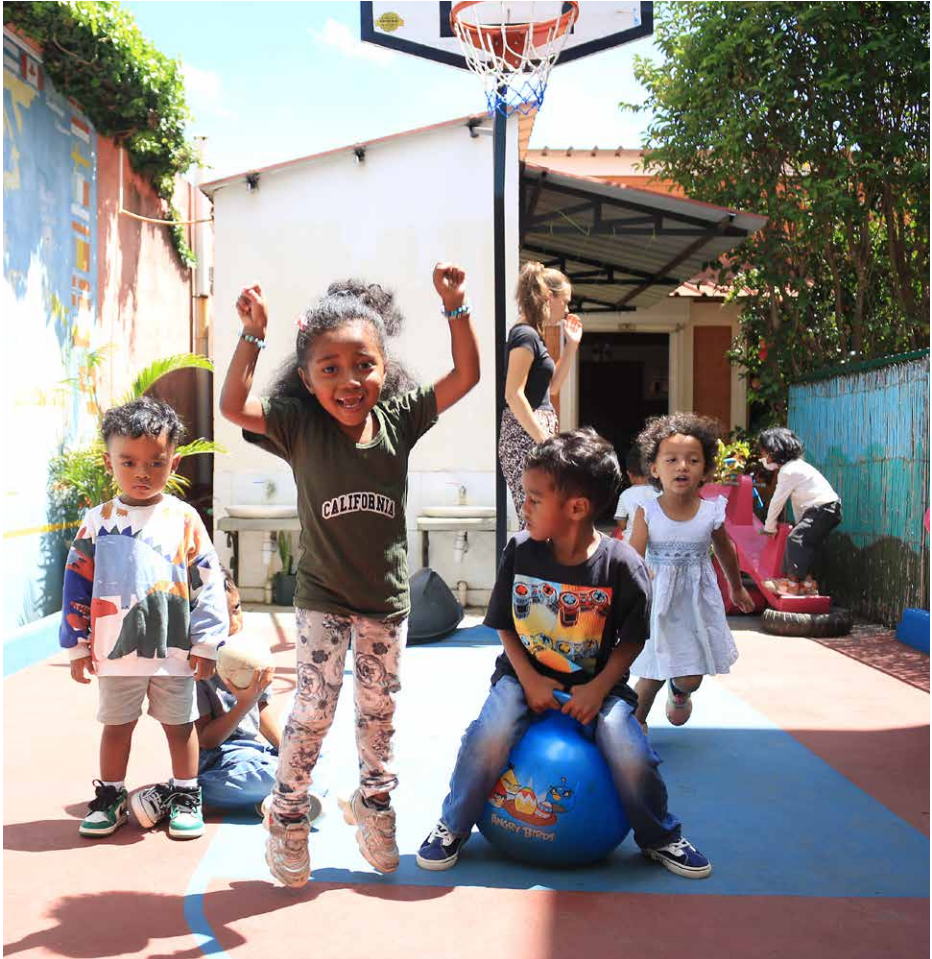
Kinder auf dem Spielplatz von Tots Haven.