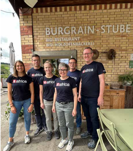
Retraite Vorstand 4africa in Alberswil.