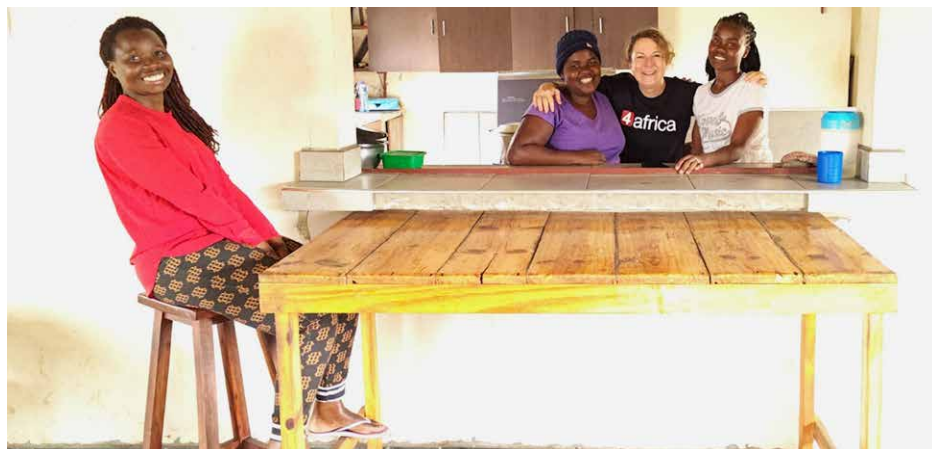
Ein persönlicher Besuch stärkt Nähe und Wertschätzung.