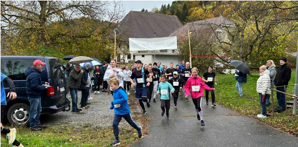
Sponsorenlauf in Brittnau.