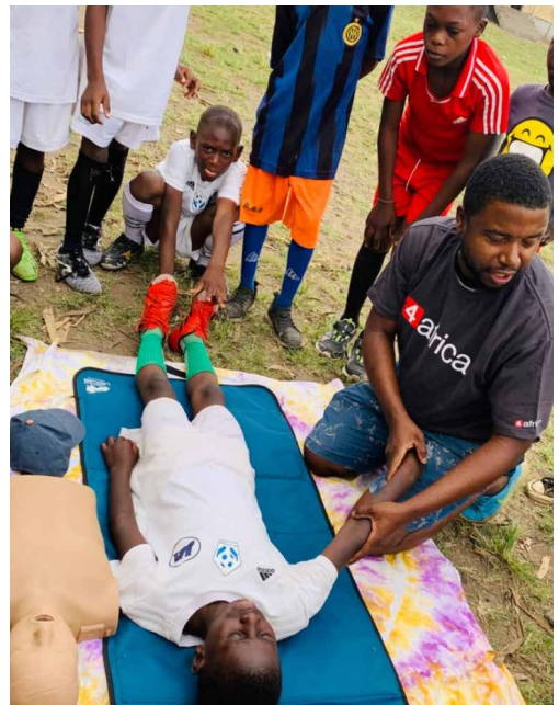
Lebensrettende Sofortmassnahmen trainieren.