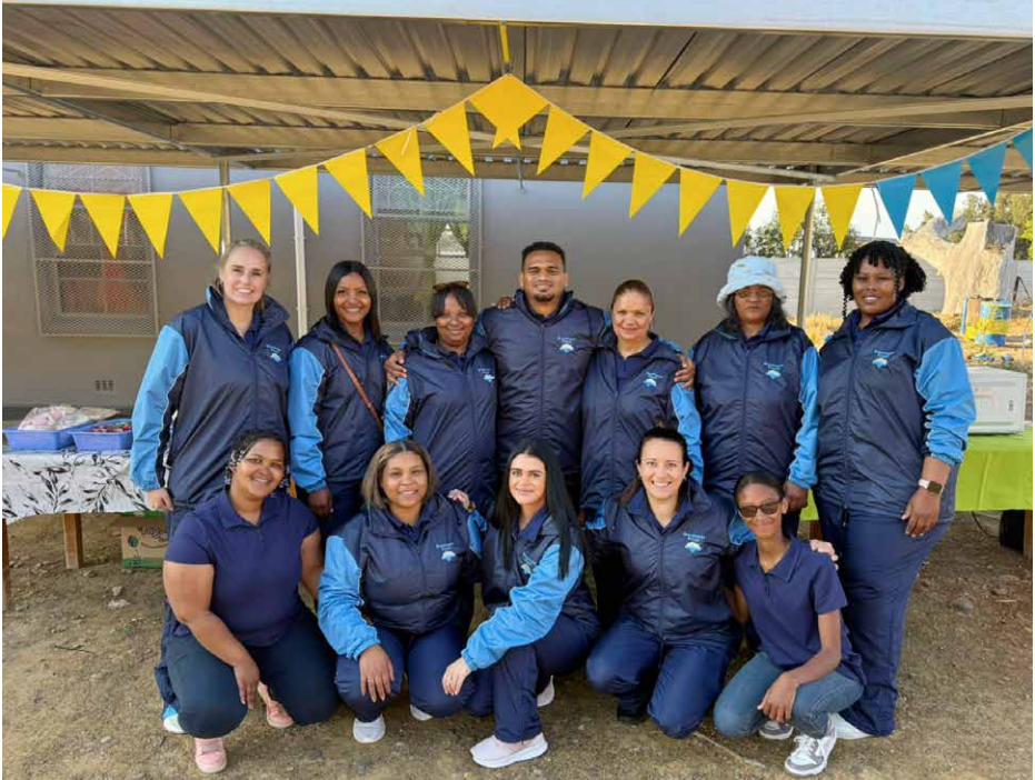
Die Lehrkräfte der Brandwacht-Schule: Gute Schulbildung ist ihnen ein Anliegen.

zu glauben, anstatt sich an «schlechten» Vorbildern zu orientieren. Viele Kinder haben alkohol- und/oder drogenabhängige Eltern und erleben viel Gewalt.