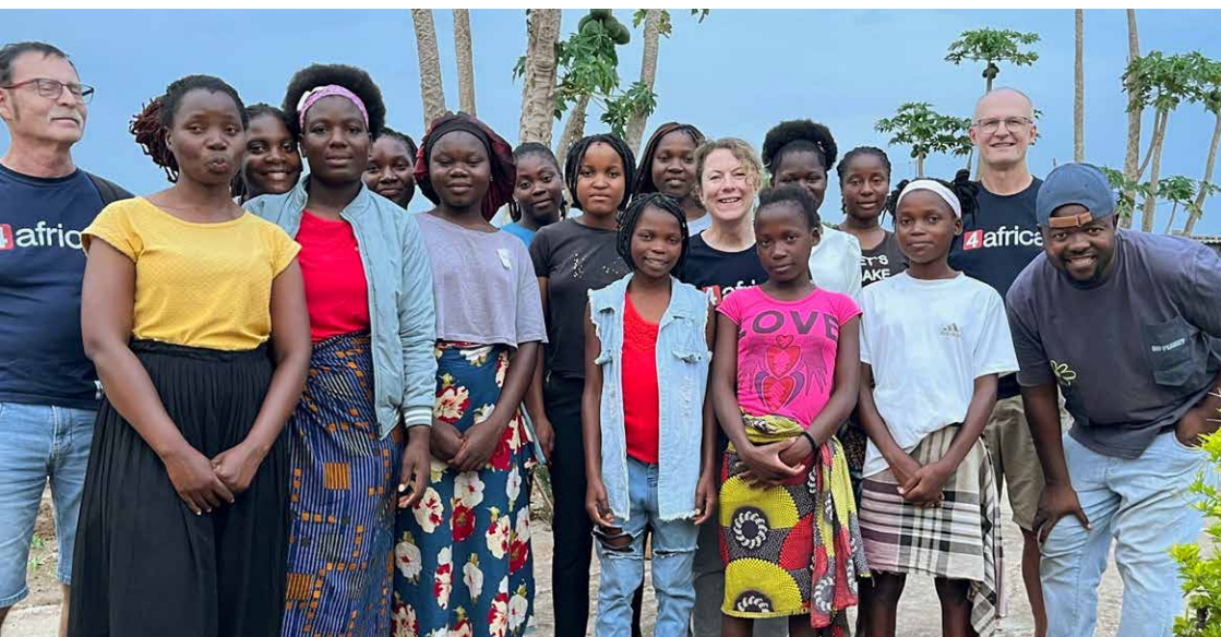
Die Delegation von 4africa auf Besuch in Moamba.