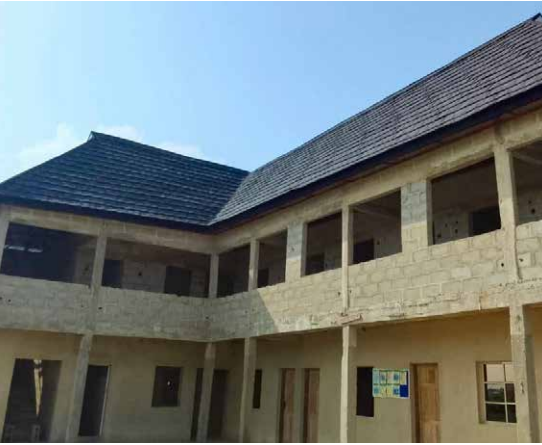
Aufrichte des neuen Schulgebäudes.