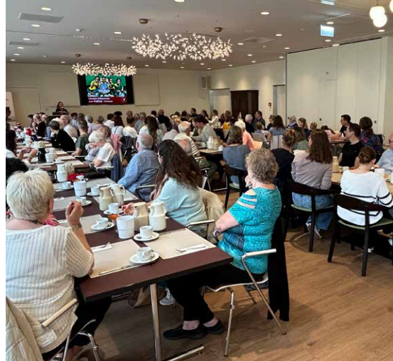
Brunch im Sennhof Vorderwald.