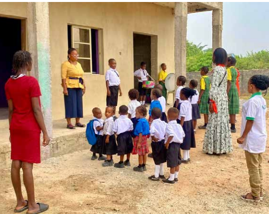
Gemeinsamer Schulstart der kleinsten Schulkinder.

In Nigeria können viele Kinder nicht zur Schule gehen. Ihre Familien sind zu arm. Die Prime Top-Notch Montessori School gibt genau diesen Kindern eine Chance. Kinder, die sonst keine hätten. Die Vision: Junge Menschen zu selbstbewussten Persönlichkeiten erziehen, die Verantwortung übernehmen und auf Basis christlicher Werte ihre Gemeinschaft stärken.