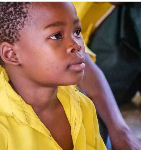
Konzentriert im Unterricht.