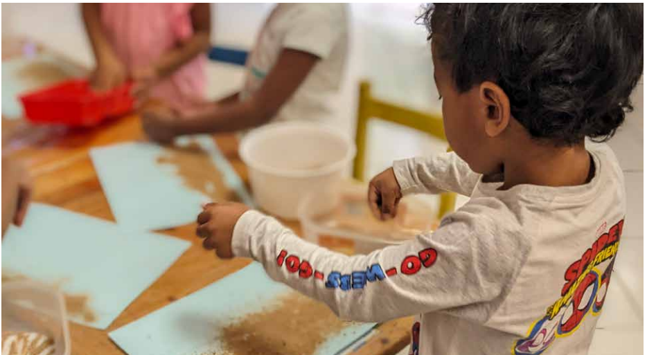
Ein Schulkind von Tots Haven.