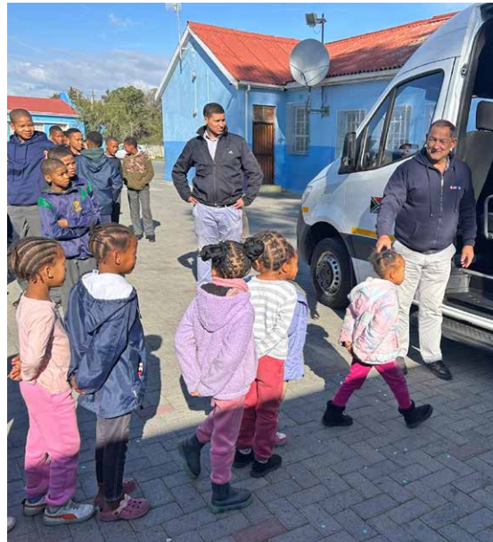
Sicherer Transport dank dem neuen Schulbus.